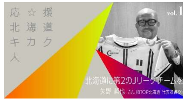
応援 北海道キカク人